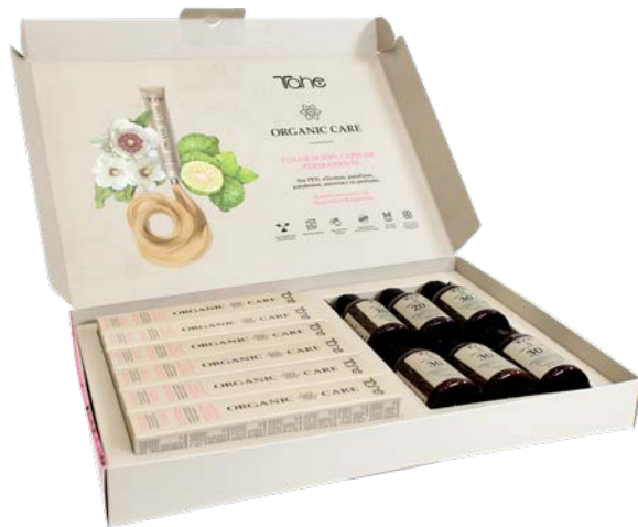
Pack Bienvenida Coloración (12054503)