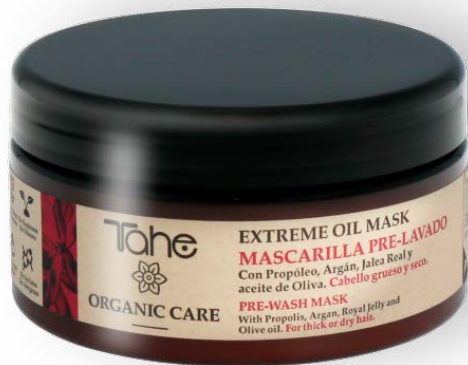
Organic Care Extreme Oil Mask 300 y 500 ml