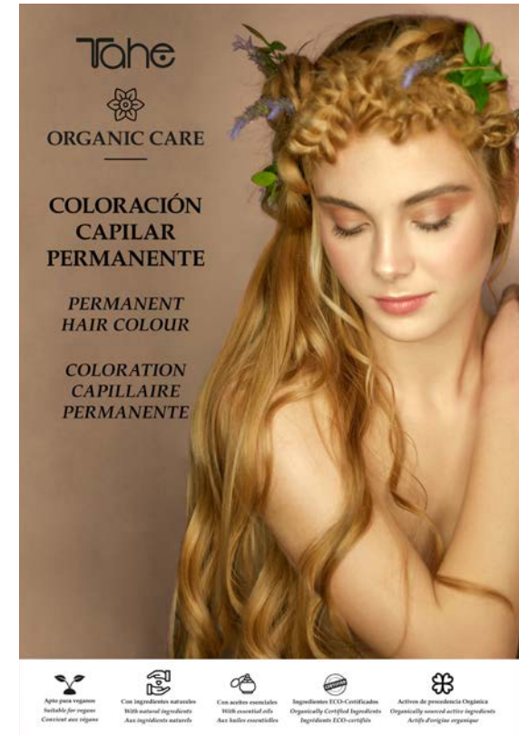
Display Tinte (12054506)