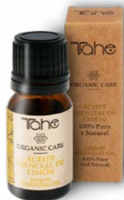
Aceite esencial Limón 10 ml