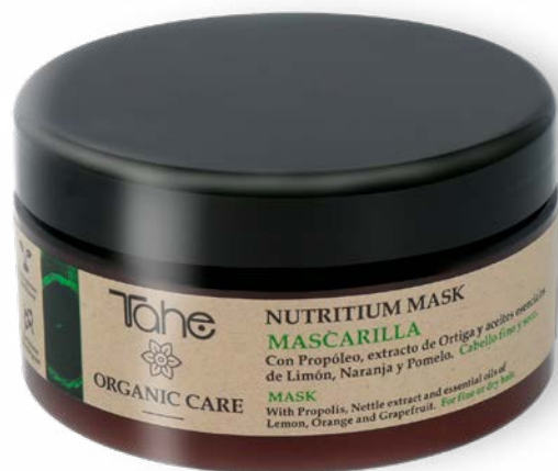
Organic Care Nutritium Mask 300, 500 y 1000 ml