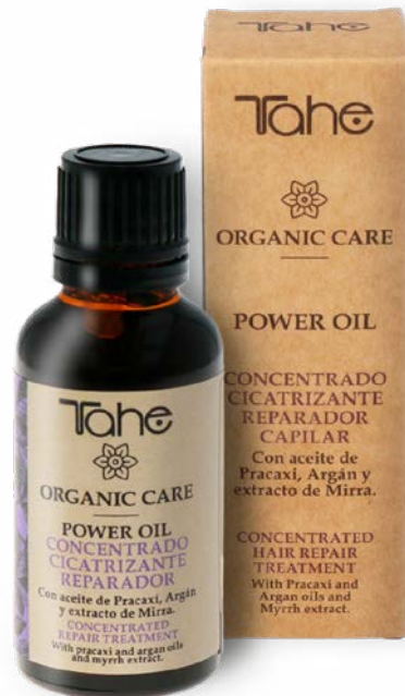
Organic Care Power Oil 30 ml