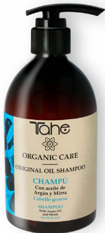
Organic Care Original Oil Shampoo