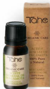
Aceite esencial Bergamota 10 ml