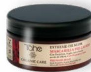
Extreme Oil Mask