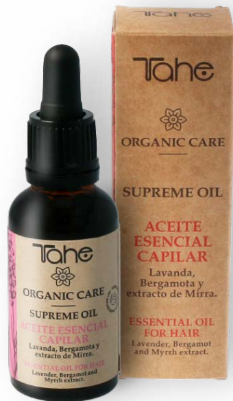
Organic Care Supreme Oil