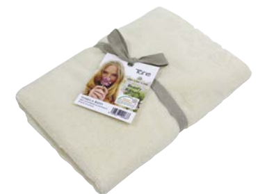
Toalla Algodón ecológico (12049049)