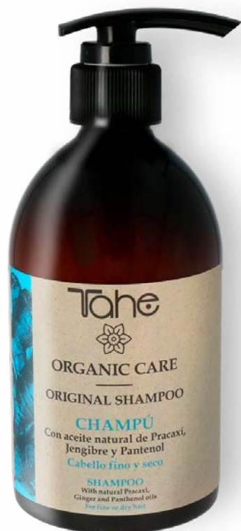
Organic Care Original Shampoo