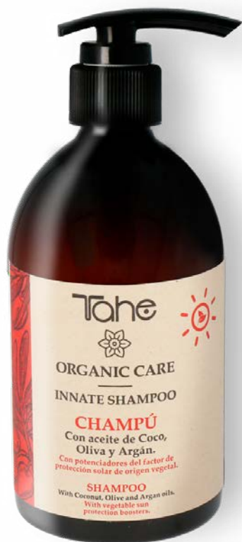
Organic Care Innate Shampoo