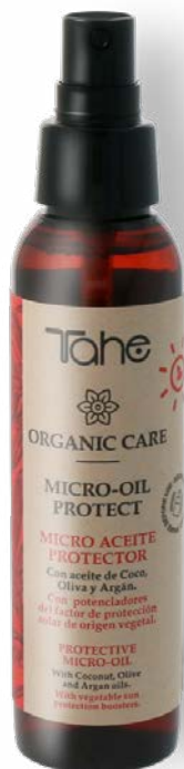
Organic Care Micro-Oil Protect