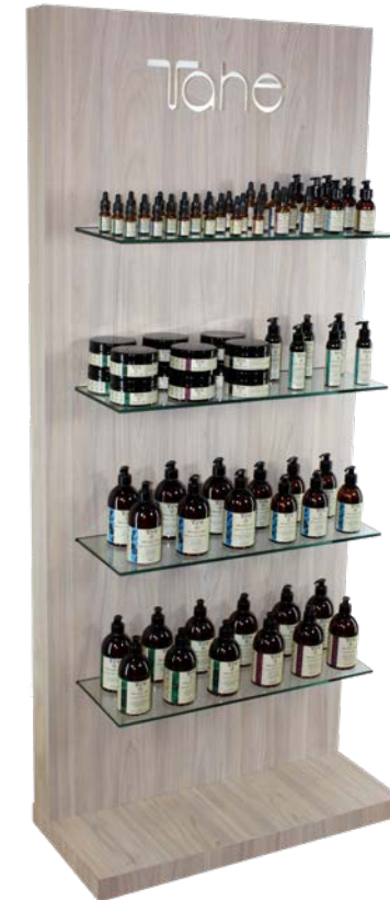
Expositor Madera con Luz (88880155)