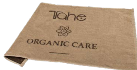
Toallas Tinte Organic (12049082)