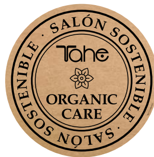
Vinilo Escaparate (11001072)