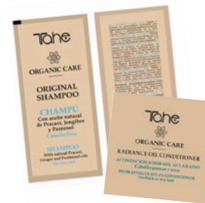
Sobres Muestras (Original Sh/ Original Oil Shampoo/ NutriBum Mask/NutriBum Oil Mask/Radiance CondiBoner/ Radiance Oil CondiBoner)