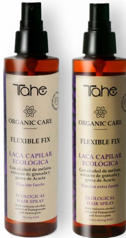
Organic Care Flexible Fix 200 ml