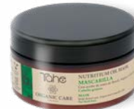
Nutritium Oil Mask