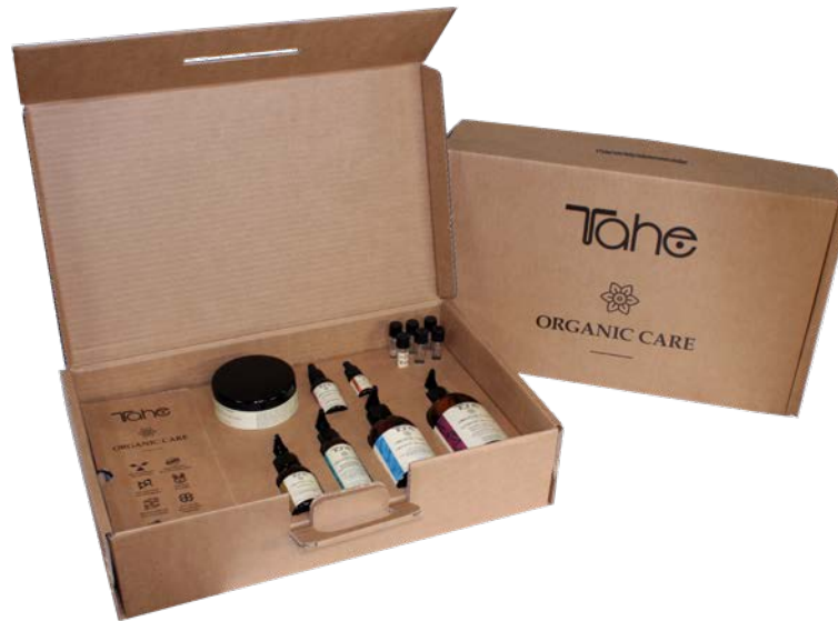
Maletín vendedores (11001044)