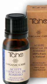
Aceite esencial Romero 10 ml