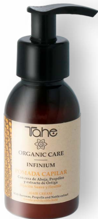
Organic Care Infinium 100 ml