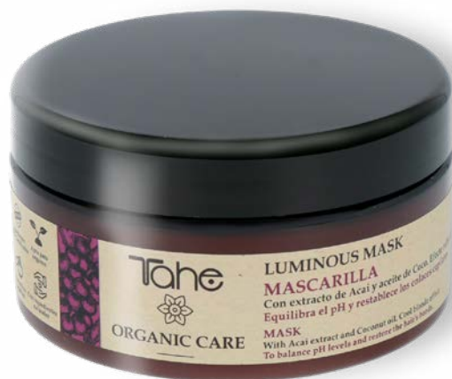
Organic Care Luminous Mask 300 ml