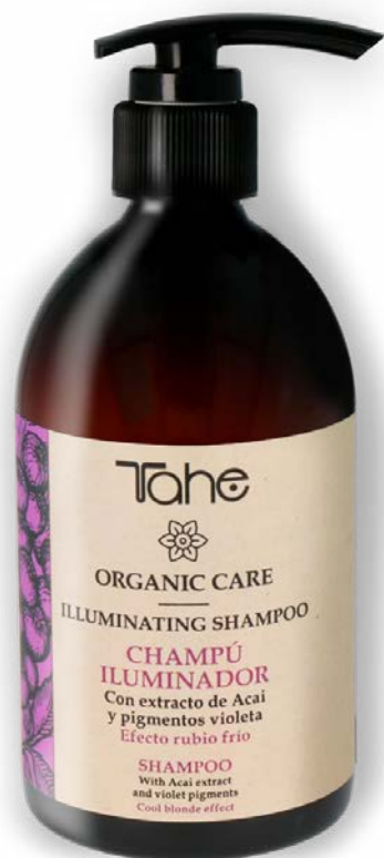
Organic Care Illuminating Shampoo