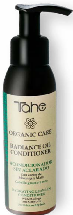
Organic Care Radiance Oil Conditioner