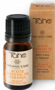
Aceite esencial Naranja 10 ml