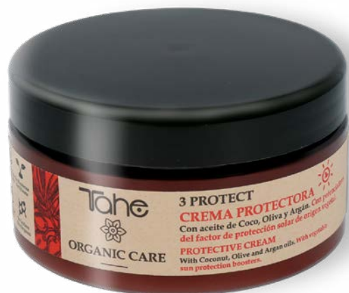
Organic Care 3 Protect