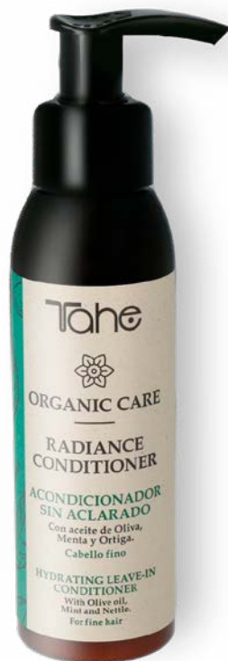
Organic Care Radiance Conditioner 100 ml