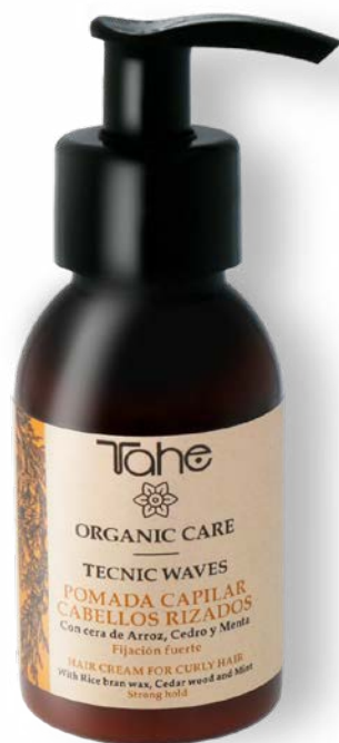
Organic Care Tecnic Waves 100 ml