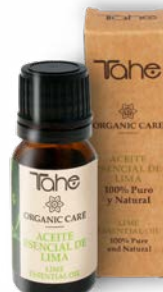
Aceite esencial Lima 10 ml