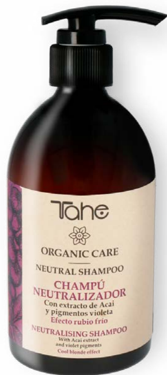
Organic Care Neutral Shampoo