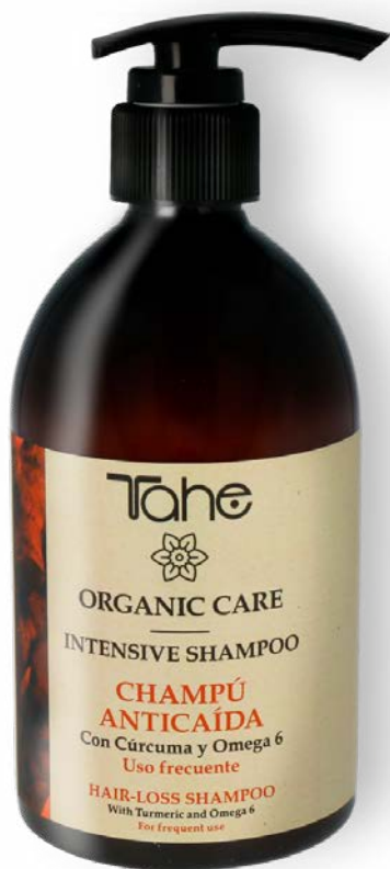
Organic Care Intensive Shampoo