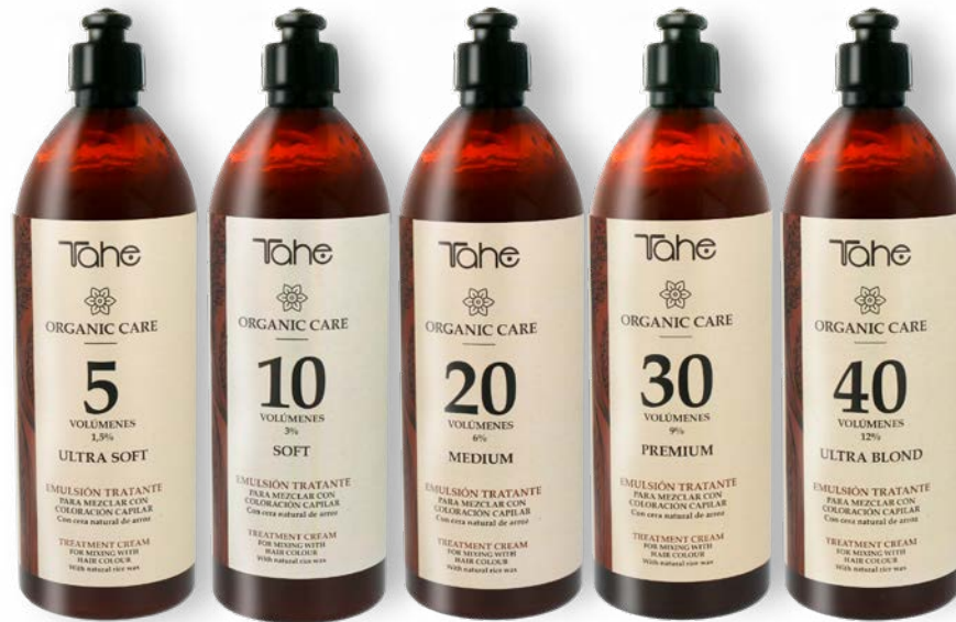
Organic Care Emulsión tratante 100 y 900 ml