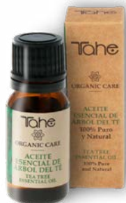
Aceite esencial Árbol del Té 10 ml