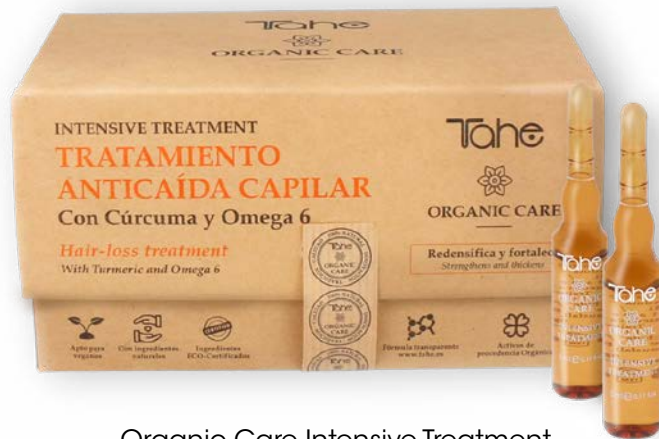
Organic Care Intensive Treatment