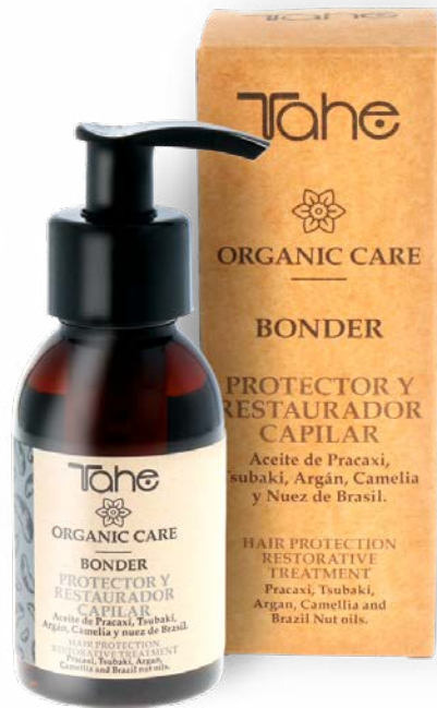
Organic Care Bonder 100 ml