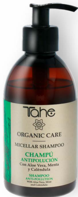
Organic Care Micellar Shampoo